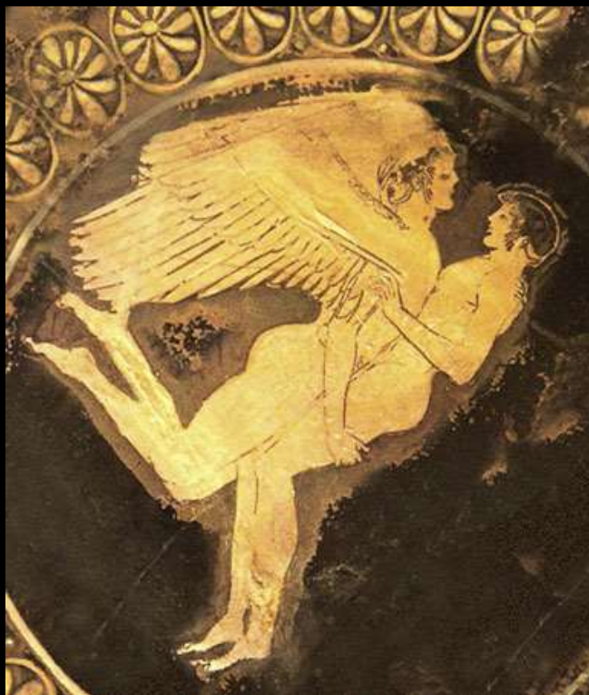
Зефир и Гиацинт. Последний был героем гомосексуалов Спарты. Краснофигурный кубок из Тарквинии, гр. 490 г. до н.э.

Есть Демоны, которые приходят к людям Третьего пола и людям с Двойной Душой / Душам-Близнецам для вечной любви. Есть Демоны, которые хотят прийти к тем, кто способны оценить их благородную и прекрасную натуру и вечную нежную любовь. Они умеют ценить нашу преданность. Они не бросаются человеческими сердцами.