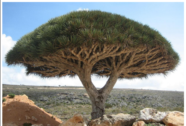
(boom van de Dracaena familie)

'Dragons Blood' is een hars die gewonnen wordt uit bomen van de Croton, Dracaena, Daemonorops, Calamus rotang of Pterocarpus familie (of soms een mengeling van). De helder rode hars die vrijkomt, heeft het uitzicht van bloed.